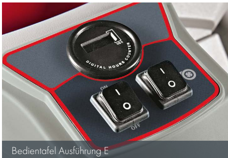
Bedientafel Ausführung E