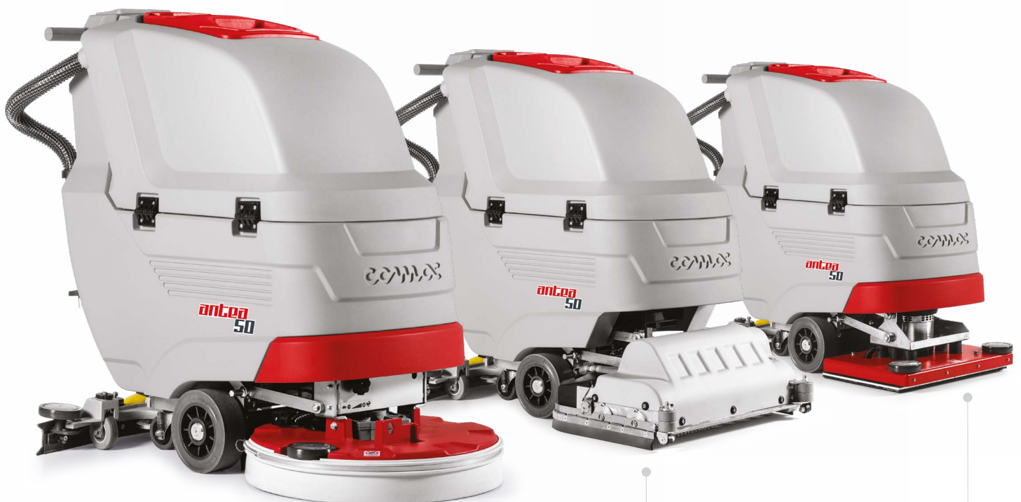
ANTEA 50 E/B/BT Version Bürstenkopf mit Tellerbürsten