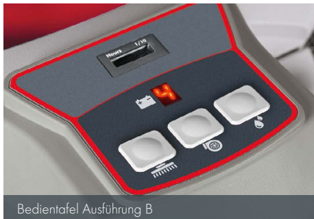
Bedientafel Ausführung B