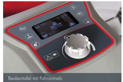
Bedientafel mit Fahrtrieb

Die antriebslosen Ausführungen (Antea 50 E/B) sind mit einer einfachen und intuitiven Bedientafel ausgestattet.